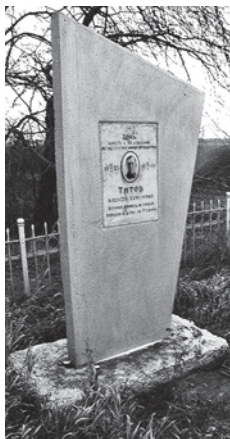
Обелиск у края лесополосы.