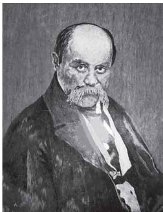
М.Г.Белоусова-Каракаш. Портрет Т.Г.Шевченко по рисунку И.Е.Репина. Художественная гладь.

Интересна и актуальна музыкальная шевченкиада бердянского композитора и музыканта В.М.Изотова, которая получила положительные отзывы от музея и мемориального парка им. Т.Г.Шевченко (Торонто, Канада).