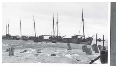
Fischerflotte im Hafen Berdjansk

Поэтому в море рыбаки выходили с четко установленного места. На Песках, по воспоминаниям Н.И.Беляева, оккупанты организовали контору, что-то вроде прежнего колхоза. Правила были такие: с утра собирались и выходили в